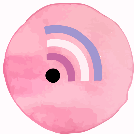
TAM TAM FRA TUTTI I SOCIAL NETWORK NEL MODO DELLA MUSICA E DEI FIORISTI